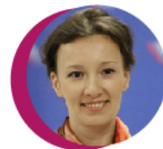
УПОЛНОМОЧЕННЫЙ ПРИ ПРЕЗИДЕНТЕ РФ ПО ПРАВАМ РЕБЕНКА АННА КУЗНЕЦОВА