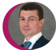
МИНИСТР ТРУДА И СОЦИАЛЬНОЙ ЗАЩИТЫ МАКСИМ ТОПИЛИН