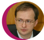
МИНИСТР КУЛЬТУРЫ РФ ВЛАДИМИР МЕДИНСКИЙ