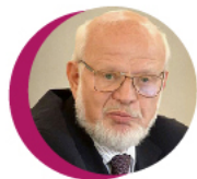
ПРЕДСЕДАТЕЛЬ СОВЕТА ПРИ ПРЕЗИДЕНТЕ РФ ПО ПРАВАМ ЧЕЛОВЕКА МИХАИЛ ФЕДОТОВ