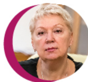
МИНИСТР ОБРАЗОВАНИЯ И НАУКИ РФ ОЛЬГА ВАСИЛЬЕВА